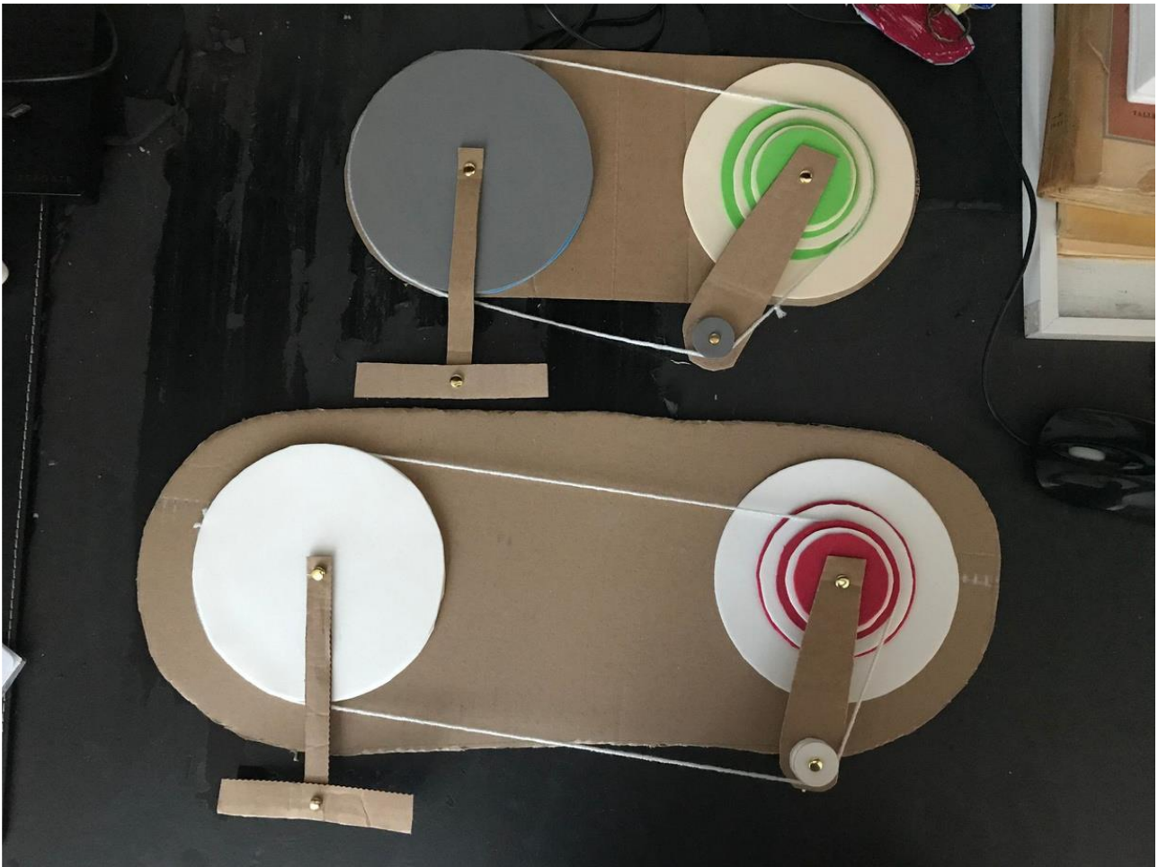
UDA: AMICI DELLA BICI -LE LINEE DEL RISPETTO