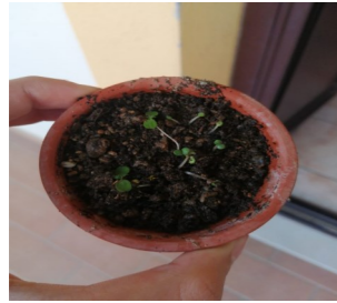
Il basilico ( Ocimum basilicum )